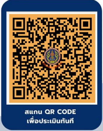
สแกน QR CODE เพื่อประเมินทันที

เป็นส่วนหนึ่งในการประเมินคุณธรรมและความโปร่งใสในการดำเนินงาน ของหน่วยงานภาครัฐและความโปร่งใสในการดำเนินงานของหน่วยงานภาครัฐ ประจำปีงบประมาณ พ.ศ. 2567